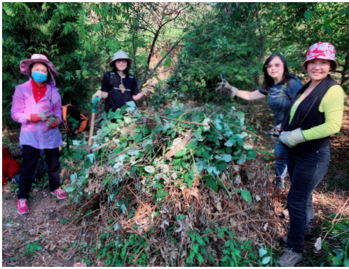
EVERETT CROWLEY PARK 公園保育活動