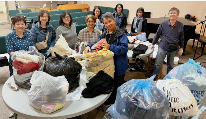
捐贈衣物活動給無家可歸者