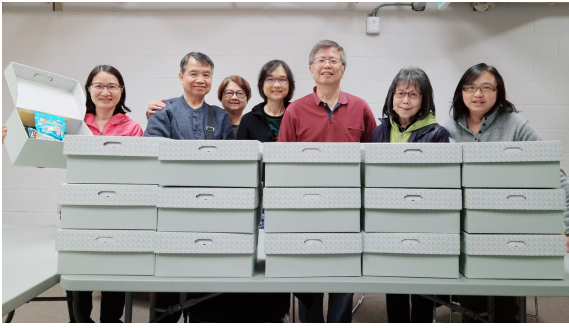
復活節禮物盒給利頓家庭